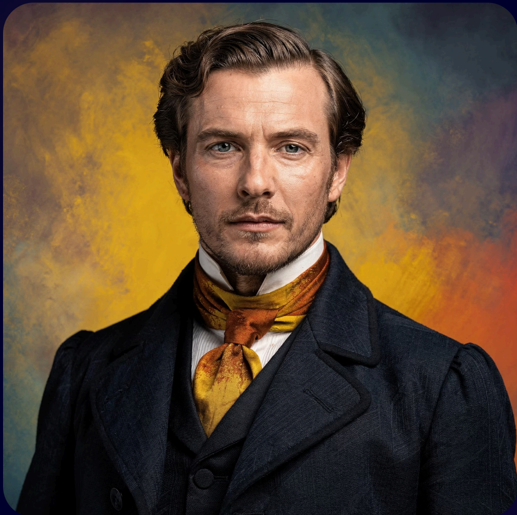
Phineas Parkhurst Quimby

Quimby foi um hipnotizador, curandeiro e precursor do movimento do Novo Pensamento nos Estados Unidos, conhecido como pai das "ciências cristãs". Ele desenvolveu uma abordagem conhecida como "cura pelo pensamento" ou "cura mental", acreditando que doenças tinham suas raízes em estados mentais e emocionais, e que a cura poderia ser alcançada através da compreensão correta dos pensamentos e crenças subjacentes (Brown, 2011).