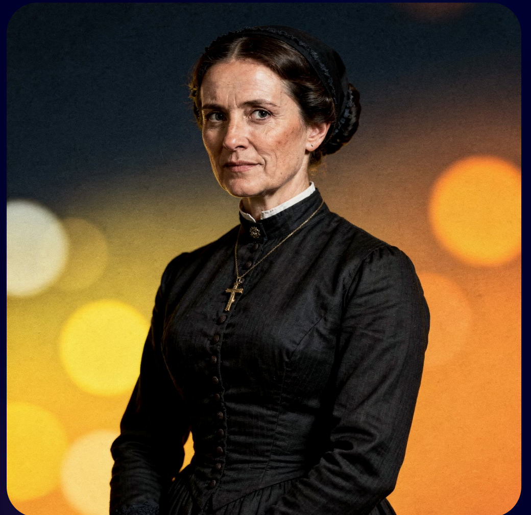
Mary Baker G. Eddy

Suas ideias influenciaram diretamente a Sra. Mary Baker G. Eddy, mais comumente conhecida como a fundadora da Ciência Cristã , uma religião com foco na cura espiritual e no entendimento dos ensinamentos de Jesus. Eddy teve contato com as ideias de Quimby após buscar sua ajuda para uma doença crônica.